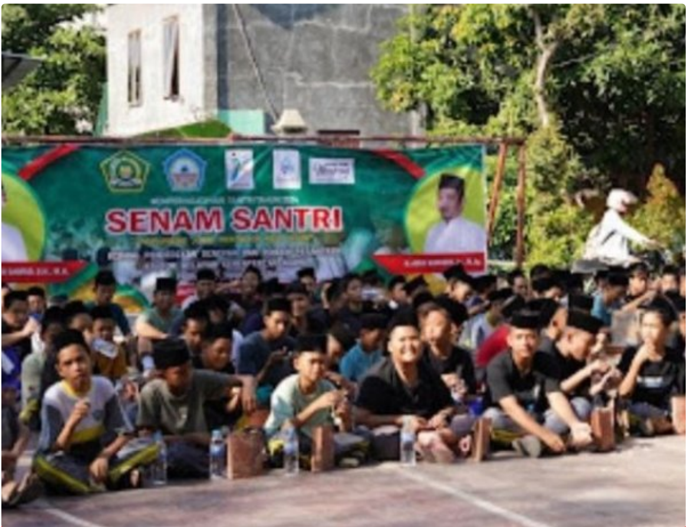
Sambut HSN, Ratusan Santri Mranggen Senam Massal, Ro'an dan Mayoran

MRANGGEN DEMAK – Ratusan santri Pondok Pesantren Futuhiyyah, Suburan, Mranggen, Demak menggelar roan, senam massal dan mayoran, Jumat pagi (18/10/2024).